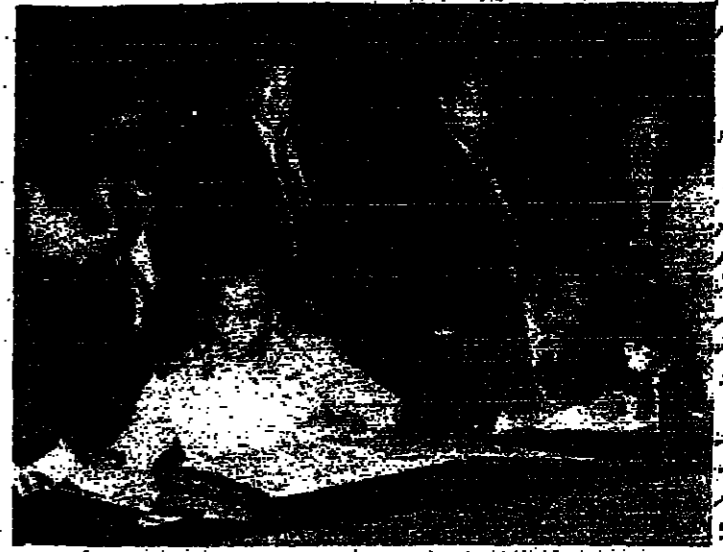
الجنرال محمد علي فهمي أثناء توقيعه لاتفاقية الإنهاء

قال الفريق محمد علي فهمي رئيس الأركان المصري - إن الاتفاقية التي تم توقيعها في سيناء، هي اتفاقية عسكرية بالدرجة الأولى وتتعلق بالوضع العسكري للمصريين في سيناء، وليس بالوضع السياسي. وأضاف الفريق محمد علي فهمي في حديث نشرته «الأخبار» أمس: إننا نعتبر في اتجاه السلام، ولا نريد أن نعيد الحرب، ولكننا نفضل أن نكون في وضع أفضل من قبل الحرب. وأضاف الفريق محمد علي فهمي: إننا نفضل أن نكون في وضع أفضل من قبل الحرب، ولا نريد أن نعيد الحرب، ولكننا نفضل أن نكون في وضع أفضل من قبل الحرب.